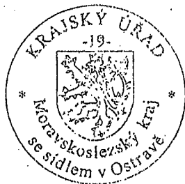
Ing. Michal Rásocha vedoucí oddělení odpadového hospodářství

Proti tomuto rozhodnutí se lze odvolat k Ministerstvu životního prostředí podáním učiněným u zdejšího krajského úřadu, a to ve lhůtě 15 dnů ode dne doručení tohoto rozhodnutí (§ 83 odst. 1 správního řádu). Odvolání musí mít náležitosti uvedené v § 37 odst. 2 správního řádu a musí obsahovat údaje o tom, proti kterému rozhodnutí směřuje, v jakém rozsahu ho napadá a v čem je spatřován rozpor s právními předpisy nebo nesprávnost rozhodnutí nebo řízení, jež mu předcházelo. Podané odvolání má v souladu s § 85 odst. 1 správního řádu odkladný účinek. Odvolání jen proti odůvodnění rozhodnutí je nepřipustné.